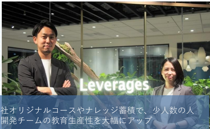
自社オリジナルコースやナレッジ蓄積で、少人数の人材開発チームの教育生産性を大幅にアップ